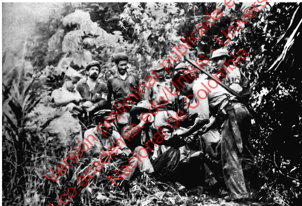
ELN EN SUS ORÍGENES