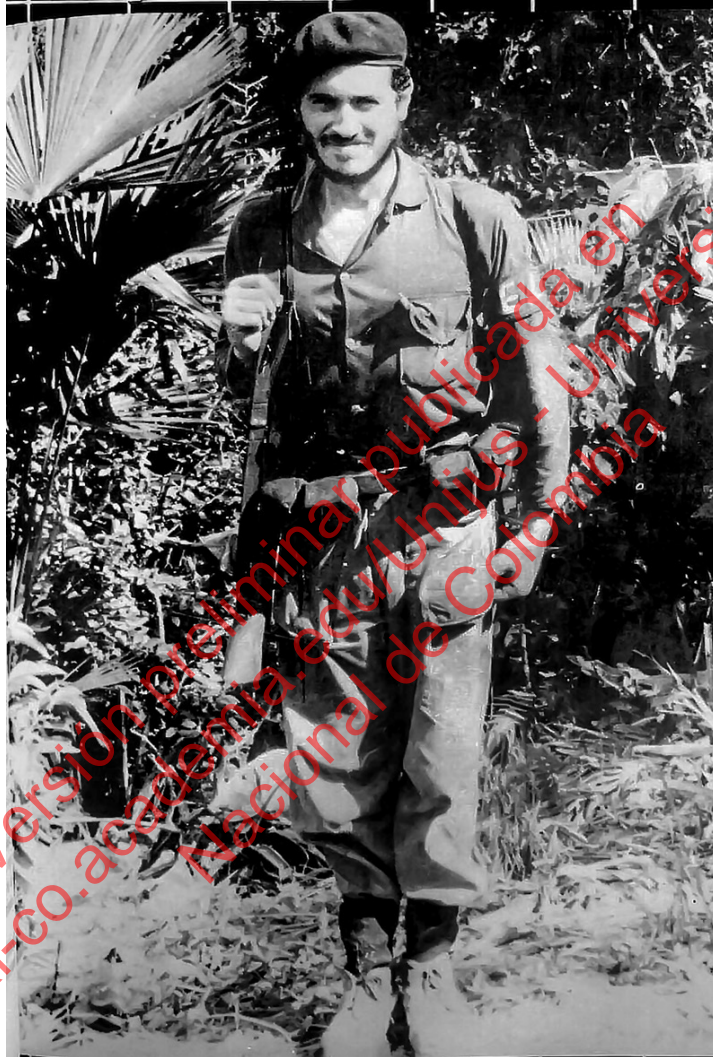
CAMILO TORRES RESTREPO EN LAS FILAS DEL ELN