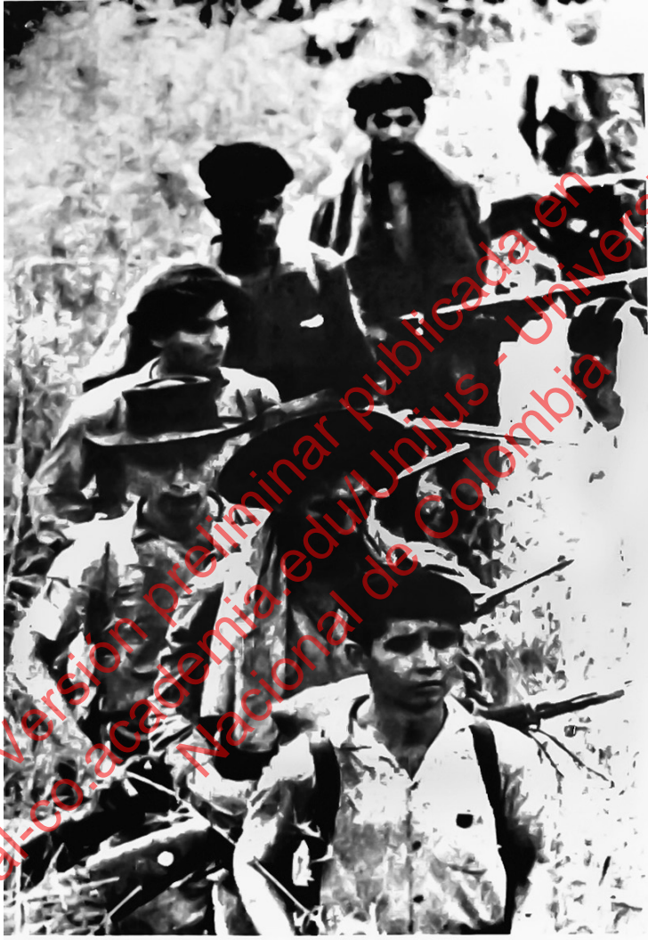
NACIMOS CON HERENCIA GUERRILLERA