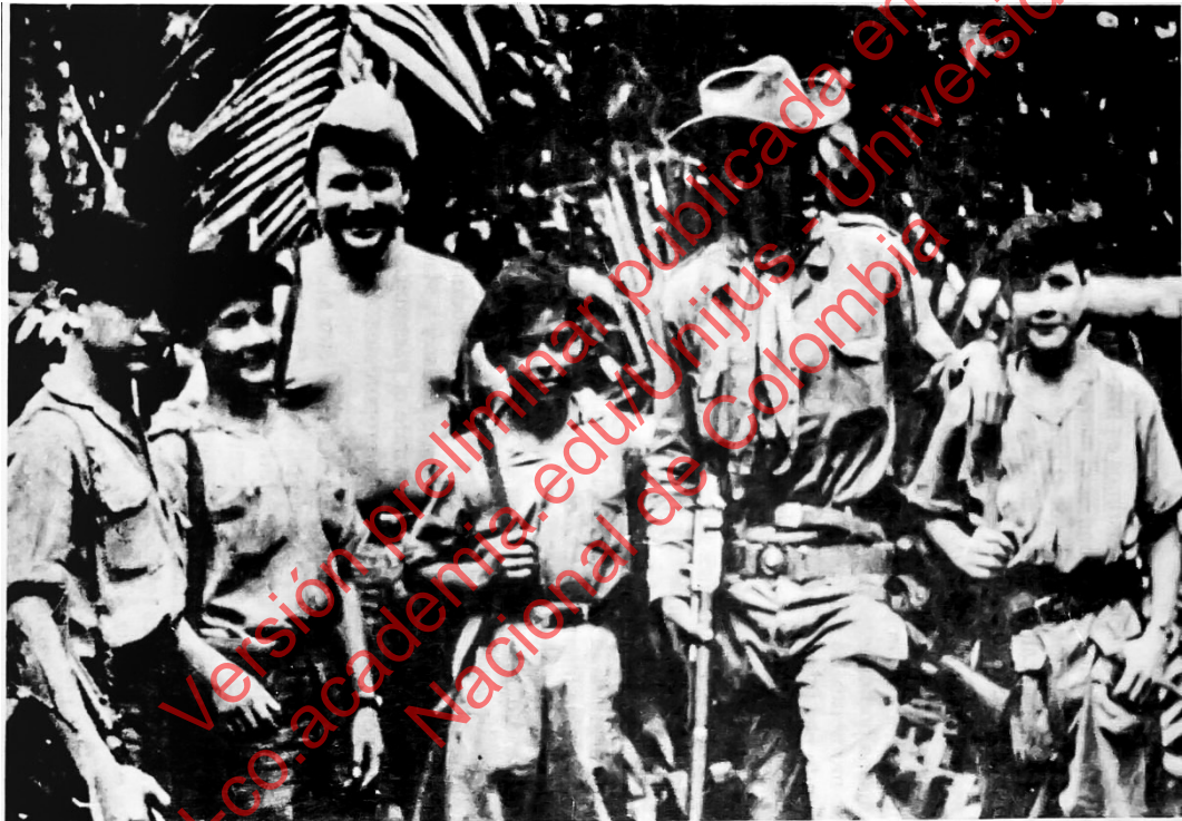
FABIO VÁSQUEZ CASTAÑO Y LOS CANCELLERES